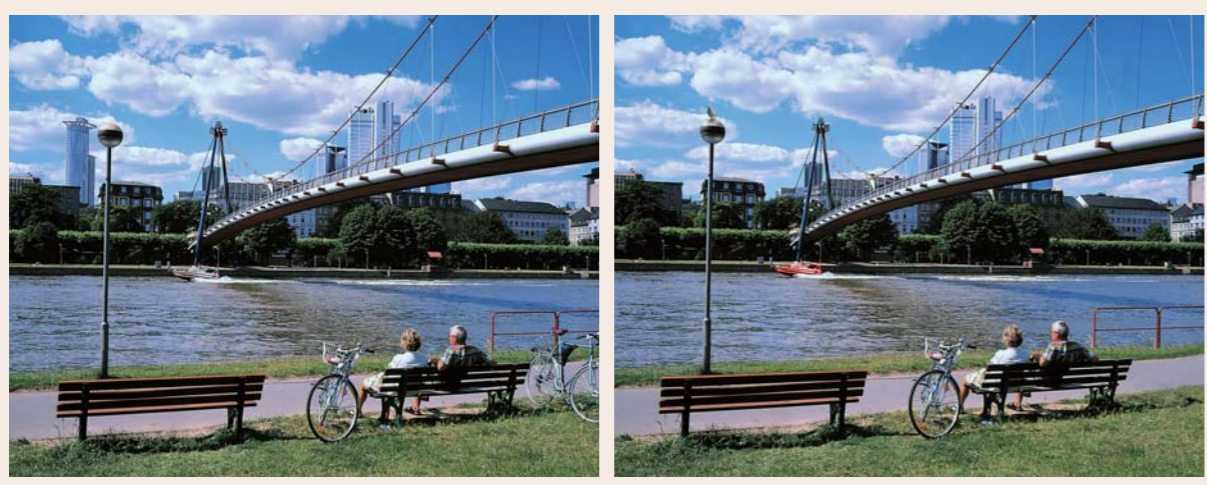
とミルト【お茶のメルト】

2枚並んだ同じ絵。でもよく見ると、まちがいがあります。 2枚を見くらべて、全部で5カ所のまちがいを見つけてください。