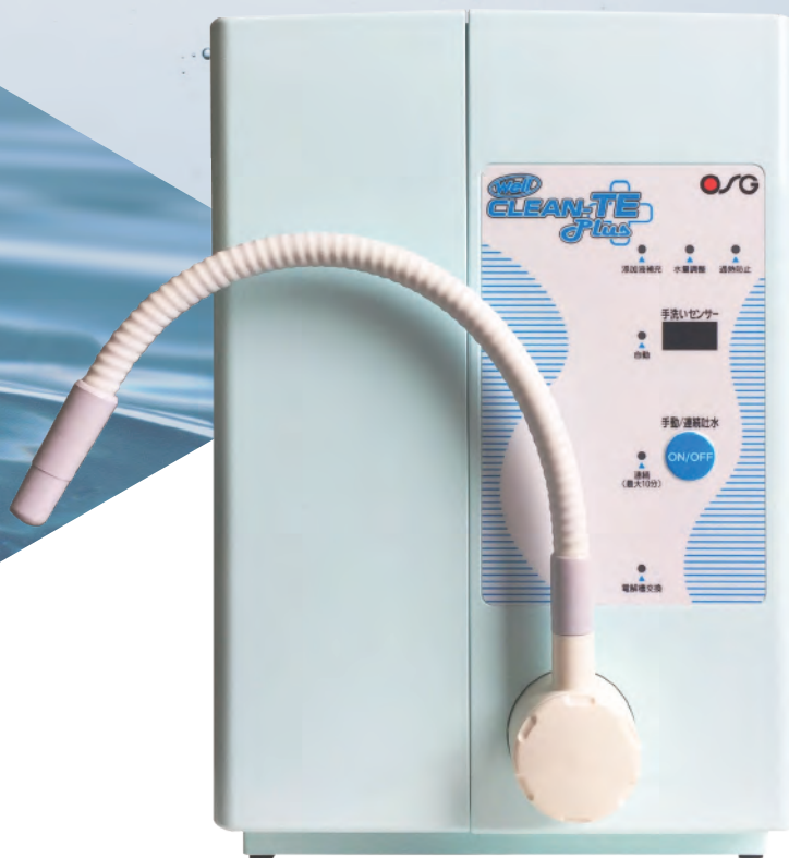
ハイクロソフト水生成装置

高度な衛生管理が求められる現場へ 「除菌力」と「使いやすさ」を兼ね備えた「ハイクロソフト水」です。