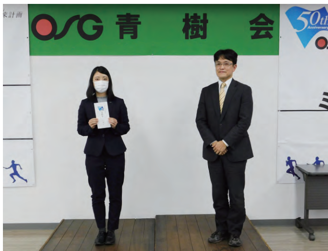
「Go To トラベル」支給式の様子 ①