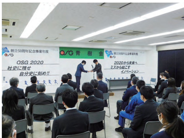
「Go To Eat」支給式の様子 ②