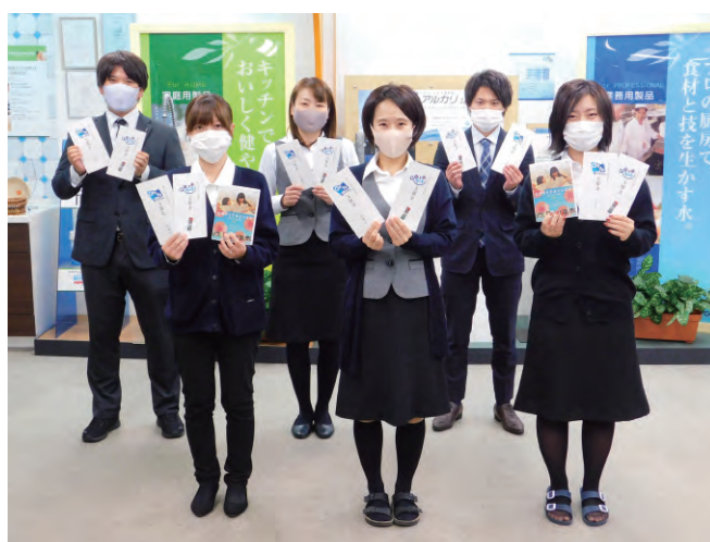
「Go To トラベル・Eat」支給の様子