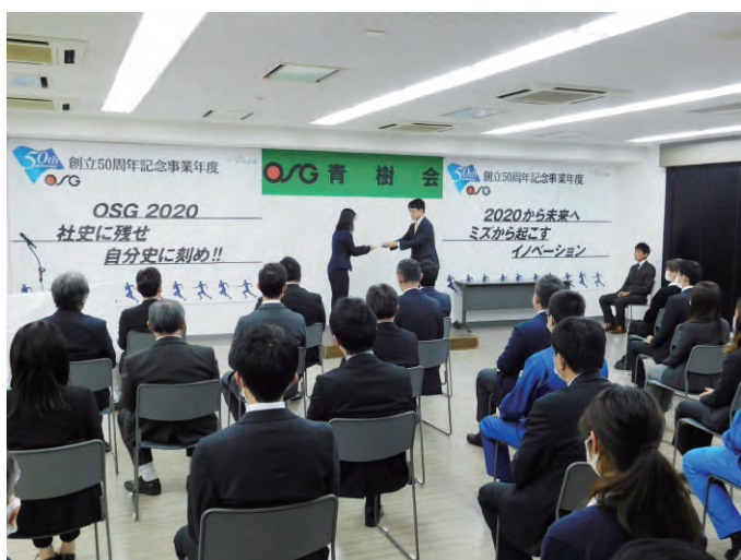
「Go To トラベル」支給式の様子 ②