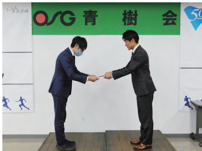
「Go To Eat」支給式の様子 ①