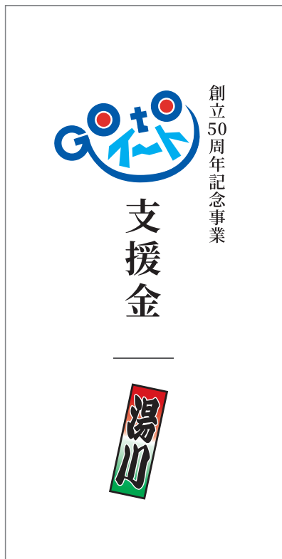
「Go To Eat」 支給用封筒 (表面)